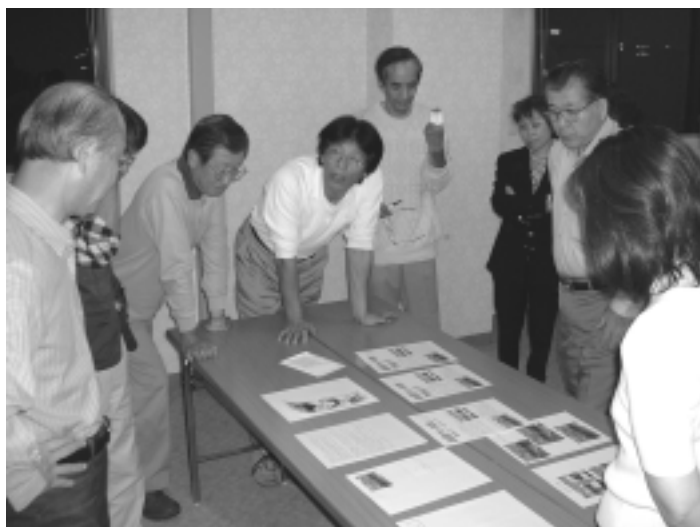
準備号作成のため、各グループへの原稿依頼、会員へのコメント収集、紙面レイアウトなど広報一丸となって突っ走ってます。 ...10月15日総合会館分室...

文化創造センター開館を迎え、『人と人』・『文化と文化』を結び、地域の文化向上の為の支援、組織づくりを目指すのが ala クルーズです。その活動を多くの人に知っていただき、参加を促すことが広報グループの役目です。