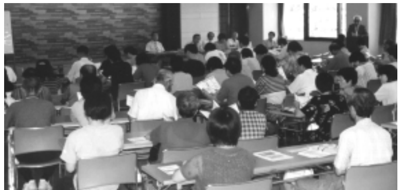
予定時間を過ぎても、活発に行われる質疑応答 ...7月15日 alaクルーズ説明会総合会館...