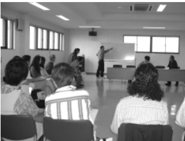
毎回活発な議論が行われる企画・創造グループ ..... 10月13日総合会館分室 .....

この企画・創造グループは、他のグループに比べ、活動内容が明確でないというところがありますが、反面今後の活動内容に大きな可能性を秘めていると思います。支援グループ・広報グループと強く連携をとりつつ能動的に活動していくことが必要でしょう。