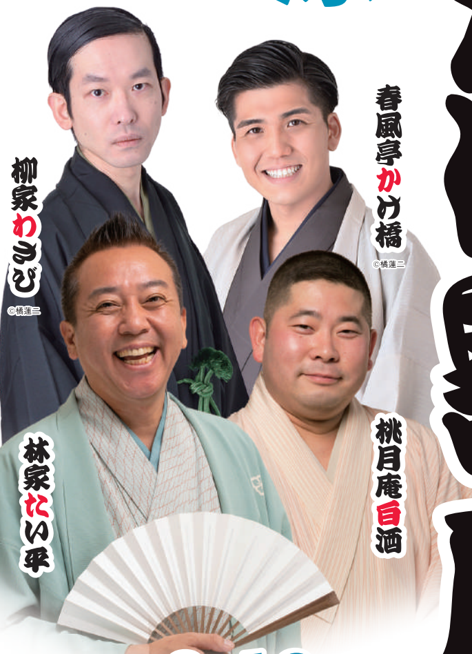
柳家わらび