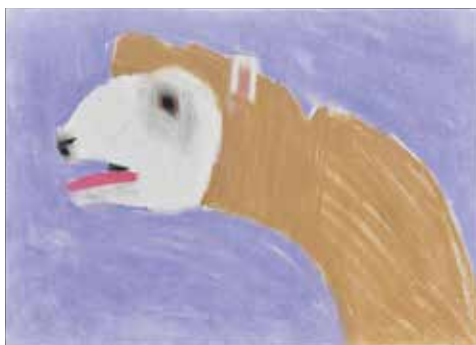
■永井 看帆 「ひつじ」パステル、紙