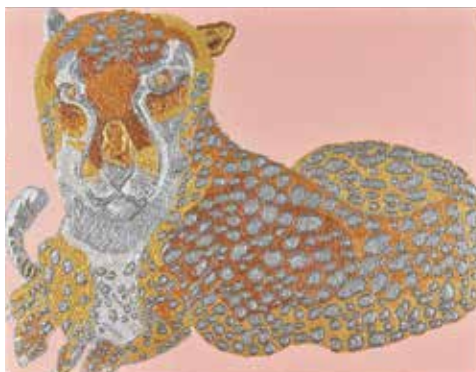
■十亀 史子 「チーター」アクリル、キャンバス