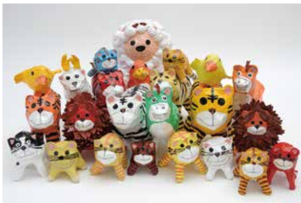
■中村 真由美 上:「ハリボテコレクション」アクリル、顔料マーカー、紙 右:「コシグロペリカン」油絵、キャンバス

〒509-0203 岐阜県可児市下恵土3433-139 URL https://www.kpac.or.jp TEL.0574-60-3311 FAX.0574-60-3312 9:00-22:30(火曜日休館)