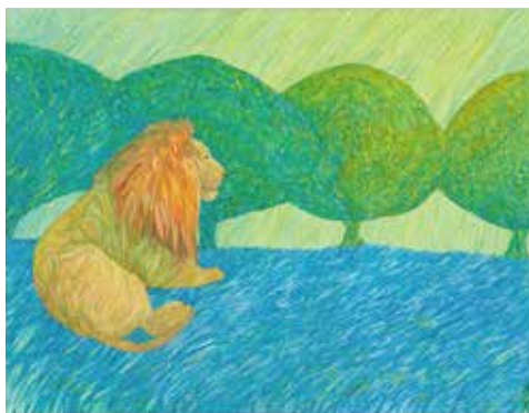
■山崎 康史 「ライオン」水彩、紙